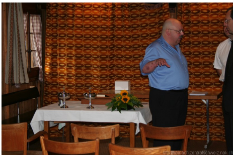
der Altar wird hergerichtet