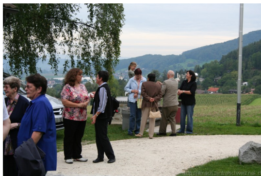
viele gute Gespräche, man trifft sich ...