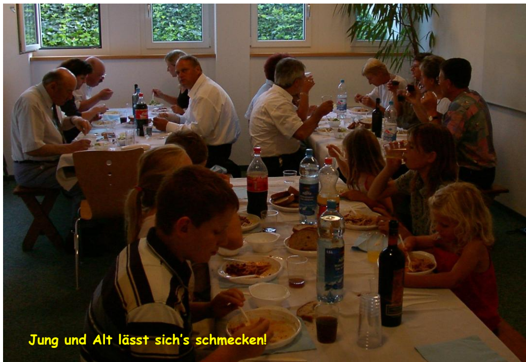
Jung und Alt lässt sich's schmecken!