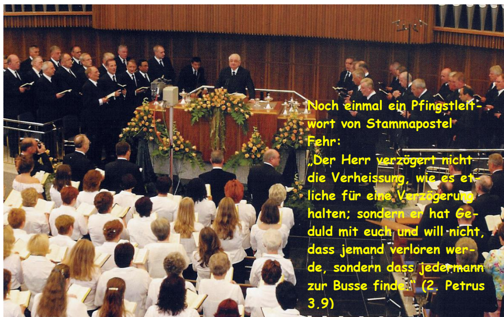
Noch einmal ein Pfingstleit- wort von Stammapostel