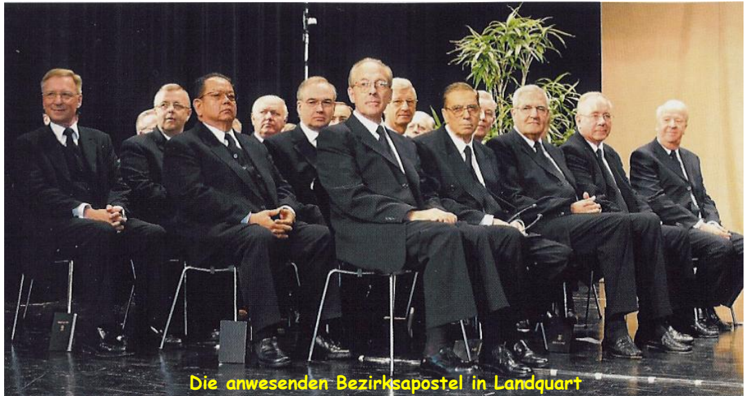
Die anwesenden Bezirksapostel in Landquart

nen Apostel. Im Zentrum aber stand das Wort aus Jakobus 1,22: „Seid aber Täter des Worts und nicht Hörer; sonst betrügt ihr euch selbst.“