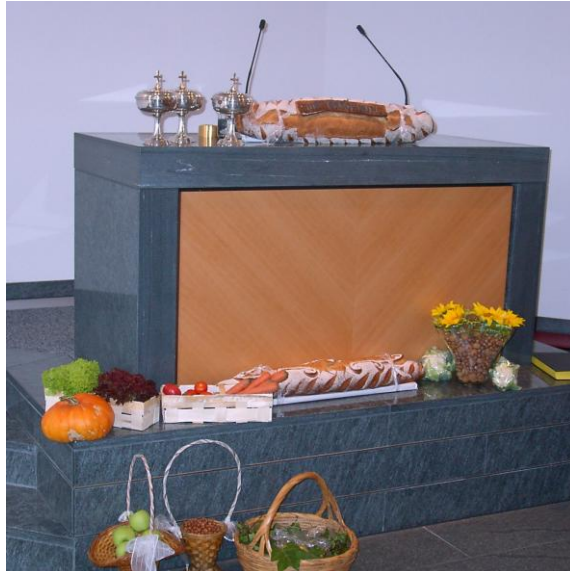
Ein ganz besonderer Altarschmuck!