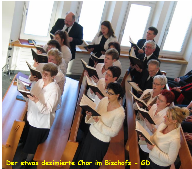
Der etwas dezimierte Chor im Bischofs - GD