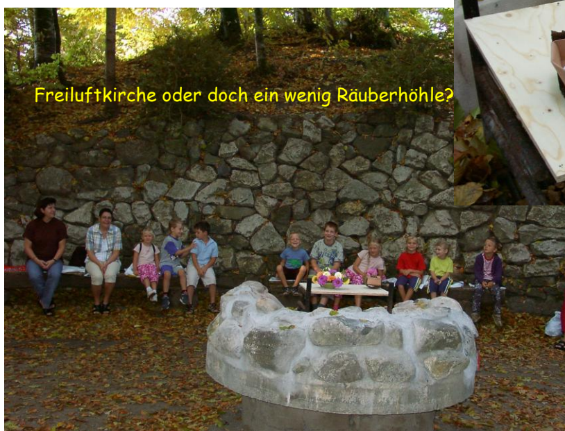
Freiluftkirche oder doch ein wenig Räuberhöhle?