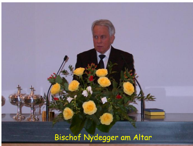
Bischof Nydegger am Altar

23. April Bischof Nydegger besuchte die Gemeinde (Lukas 24, 26). Auch er benützte die Gelegenheit, den neuen Priester im Einsatz zu sehen. Zusätzlich rief er auch den Bezirksevangelisten Meisterhans zur Mitarbeit.