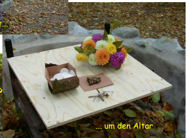
... um den Altar