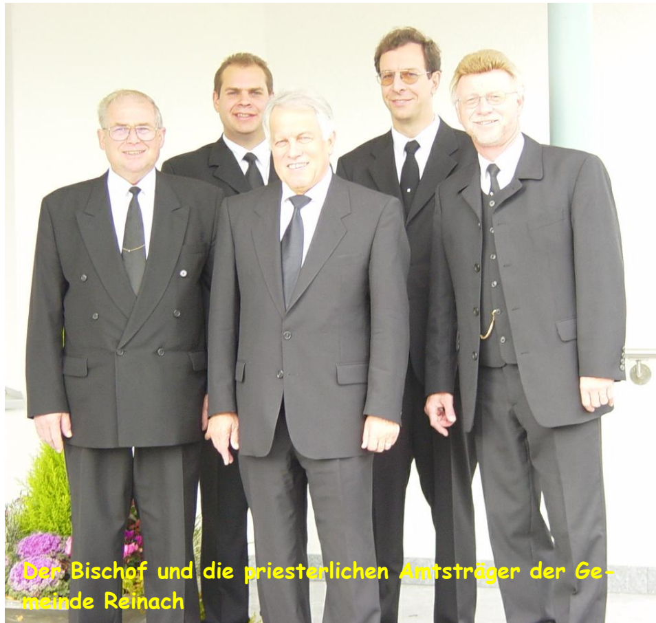
Der Bischof und die priesterlichen Amtsträger der Gemeinde Reinach

Der Sonntagsgottesdienst stand unter dem Wort aus Lukas 15, 24, einer Erinnerung an den verlorenen Sohn. Verlorene gibt es wohl in allen Gemeinden . Wo jemand zurückfindet soll er / sie in unserem Kreis immer ganz herzlich willkommen sein.